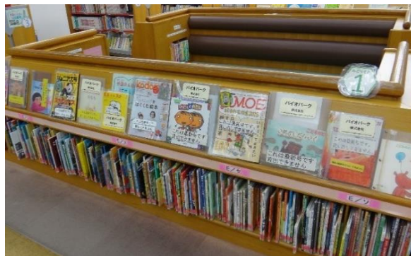
【児童室の雑誌コーナー】