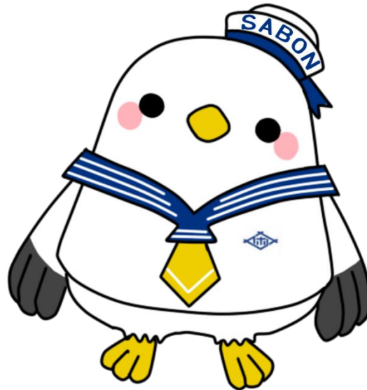
佐世保市立図書館公式キャラクター SABON（さぼん）