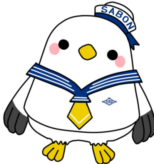
佐世保市立図書館公式キャラクター SABON（さぼん）