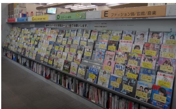
【一般室の雑誌コーナー】

佐世保市立図書館では、 約180種類 の雑誌を所蔵しており、雑誌専用のコーナーに配架しています。一般室では、総合誌、文芸誌、暮らし、スポーツ、ファッション誌など 約160種類 の雑誌を、ジャンル別に配架しています。児童室では、赤ちゃんから幼児、保護者向けの雑誌や絵本雑誌、小中学生向けの学習雑誌など 約20種類 の雑誌を配架しています。閉架書庫に、バックナンバー（最新号以前の雑誌）や寄贈された雑誌を保存しており、年に一度、保存年限が過ぎた雑誌を、「雑誌のリサイクル市」として市民に無料配布しております。（※所蔵雑誌の一覧は、当館ホームページをご参照ください。）