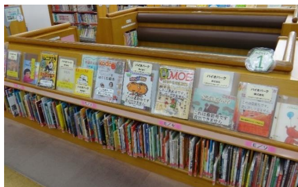
【児童室の雑誌コーナー】